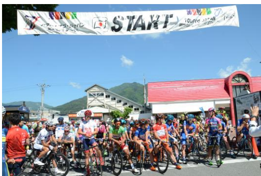
スタート地点の飯田駅前

第18回ツアー・オブ・ジャパン南信州ステージを開催した。また、レースの実施に併せて、飯田市長を始め市民・自転車競技ファンによる「パレード走行」、コース上に選手への応援メッセージを書く「チョークイベント」、また地元保育園児、小・中学生を対象に授業の一環として観戦の呼びかけを実施するなどし、地元住民や自転車競技ファンがより身近に自転車競技および自転車の魅力に触れられる機会を提供した。またレースの様子を地元ケーブルテレビや地元FMラジオ、U S T R E A Mにて中継放送を行うなど、情報発信に努めた。