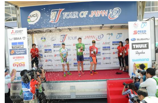
表彰式でのシールドファイト