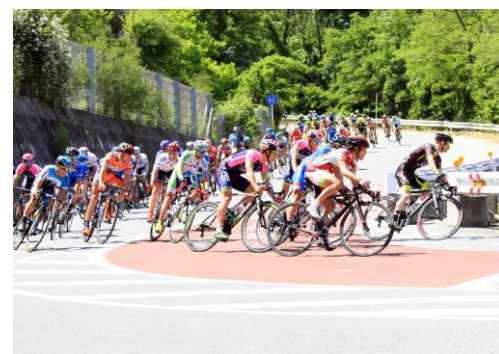
急カーブの通称「T O J コーナー」