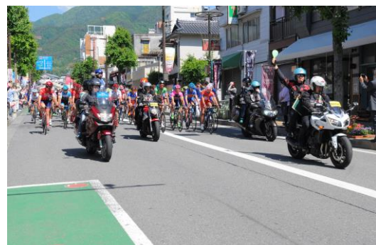
飯田駅前からのパレード走行