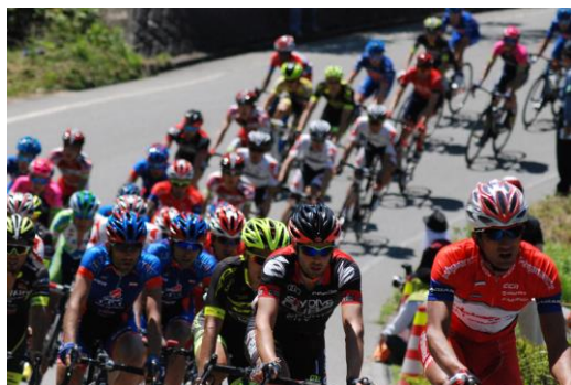
周回コースでの熱戦