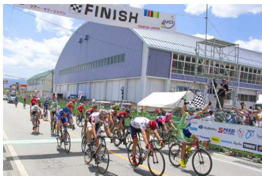
デッドヒートを制する