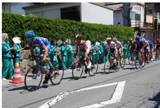
沿道の声援を受けて