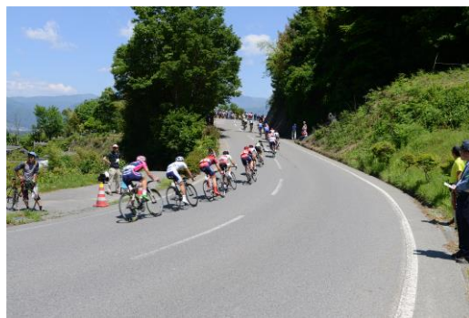
アップダウンの激しいコース